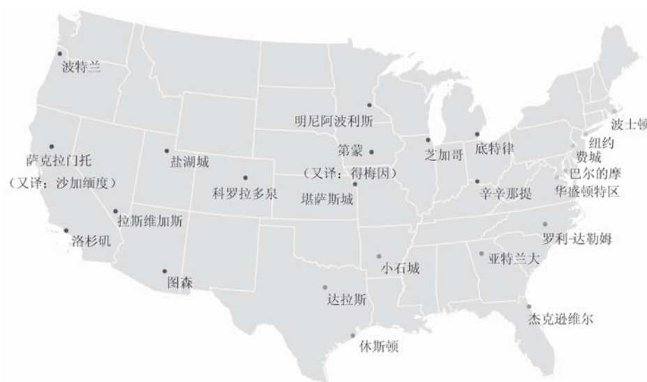
图 1 CME Group 气温衍生品美国标的地点的地理分布

附录 1 给出了 CME Group 交易的气温衍生品在美国的标的城市的所在州、所在美国版图的方位、气候类型及具体的统计情况。本文发现,这 24 个城市基本涵盖了美国的气候类型,且它们之间的差异也较大,其地理分布如图 1 所示,这些都是为了提供一个适用于各种大小不同、时间发布不同的天气头寸类型的气温衍生品篮子。