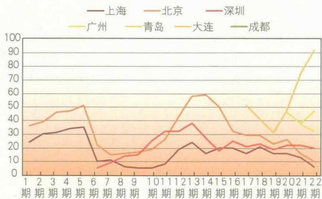
图2 中国金融中心城市在历次GFCI排名情况