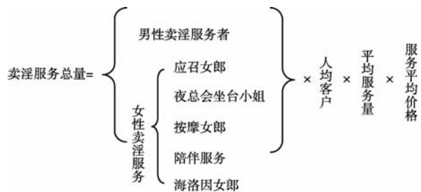
图3 卖淫服务测算关系